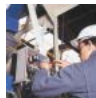
MISE EN ROUTE