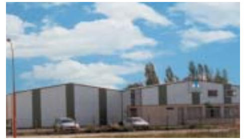
Ateliers de Saint-Mariens