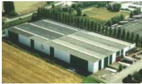
Production - Logistique - Bureau d'Etude