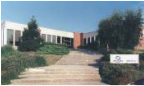
Direction Générale - Services Généraux - Export - Agence